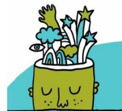
Denken, voelen, doen aan de slag met Acceptatie en Commitment Therapie een lees- en doeboek voor kinderen en jongeren Maaïke Steeman

In dit boek leer je jouw gedachten en gevoelens beter te begrijpen en je leert er woorden aan te geven, waardoor je er makkelijker over kan praten.